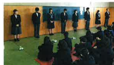
学年集会(12/23)で各クラスの総務委員が2学期の反省を話しています

いよいよ学年のまとめの時期を迎えます。次の学年に自信をもって進めるよう、一人ひとりが目標をもち、「根気」強く努力を続けてほしいと願っています。教職員一同、引き続き全力でサポートしてまいりますので、今後とも御理解と御協力をよろしくお願いいたします。