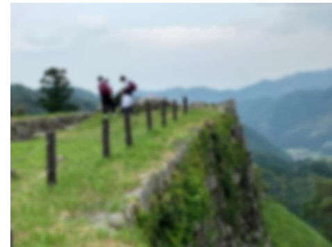
< 津和野城址 2 >