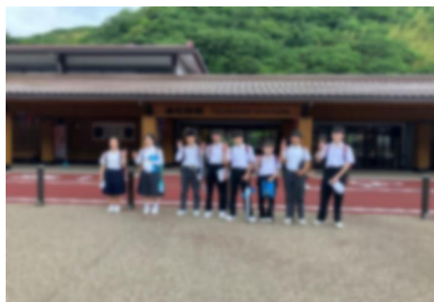
< 班別研修 3 >