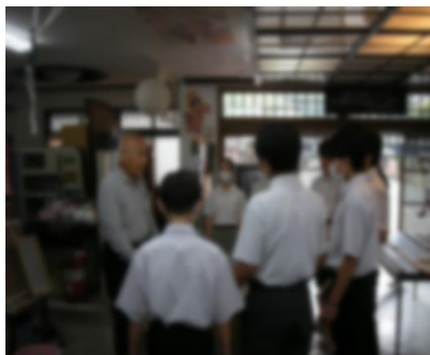
< 和紙づくり 1 >