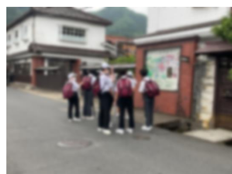
< 班別研修 2 >