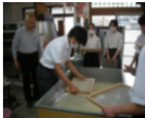
< 和紙づくり 2 >