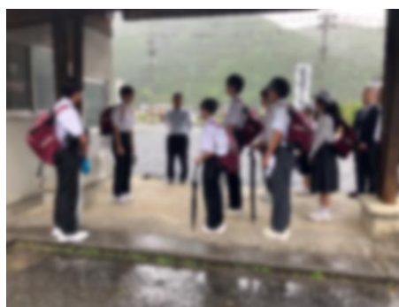
< 解散式 >