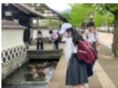
< 班別研修 1 >