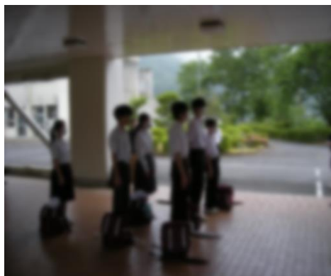
< 出発式 >

5/21(水)、2年生が津和野町に行きました。自分たちの卒業証書として使用する和紙を自らが作成し、班ごとに分かれて町内を散策するなど充実した時間を過ごしました。来年の修学旅行に向けて、良いリハーサルになりました。その活動の様子を掲載します。