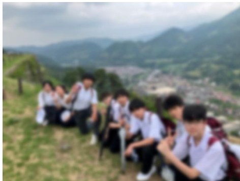
< 津和野城址 1 >