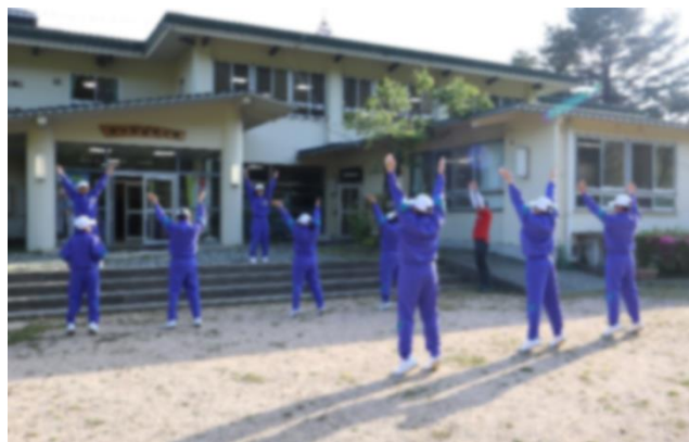
< 朝のラジオ体操 >