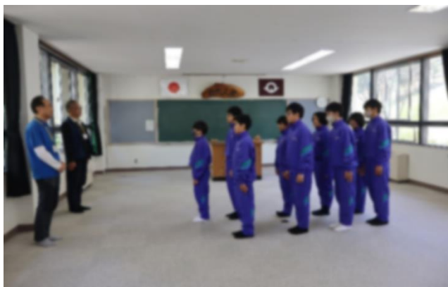
< 入 所 式 >