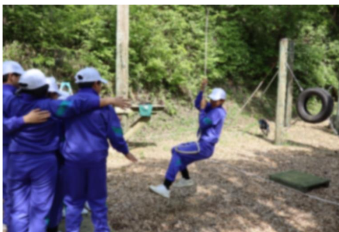
< 森のチャレンジコースⅠ >