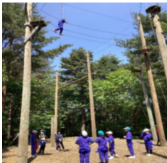
< 森のチャレンジコース2 >