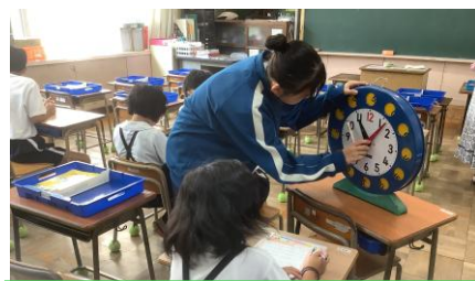
中学生や地域の人と勉強している様子

夏休みの7月22日、23日の2日間、3年生から6年生の希望者を対象に、あったか塾を開催しました。あったか塾は自主的に学習する児童を、中学生、小中学校の教員、地域の方々の有志でサポートする学習会です。事前に川下中学校でサポーターを募集したところ、のべ18名の先輩たちが参加してくれました。また、川下中学校の先生方や地域の皆様にもご協力をいただきました。児童はそれぞれの学習に取り組み、必要に応じてサポーターの皆様から助言を受けて、課題を解決したり理解を深めたりすることができました。