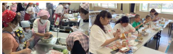
夏休みに開催「親子料理教室」・「カルトナージュ作り」

皆様とともに児童の安全確保に努めて参りますので、ご協力のほどよろしくお願いいたします。