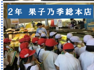
2年 果子乃季総本店