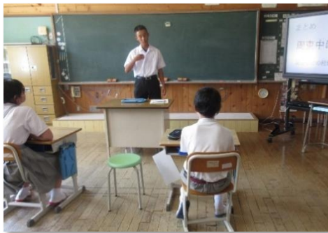
中学校生活について話す卒業生

先月、周東中学校の職場体験で卒業生が来てくれました。二日間ではありましたが、子ども達の登校の迎えから下校の見送りまで、通常の職場体験より長い時間を過ごし、授業の補助をしたり、休み時間に一緒に遊んでくれたりと実にさわやかで緊張感のある良い雰囲気を残してくれました。二日間の最後の授業時間には、高学年児童に「周北小学校で体験したことは、中学校でもきっと役立つ」と語ってくれました。立派に成長したその姿と言葉を支えにして、残りの半分の精一杯頑張っていきたいと考えています。