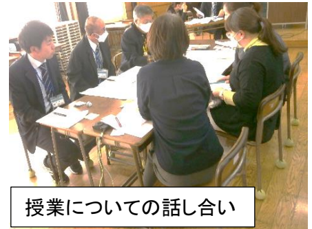
授業についての話し合い