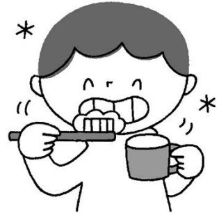
丁寧なブラッシングを続けることで改善できる