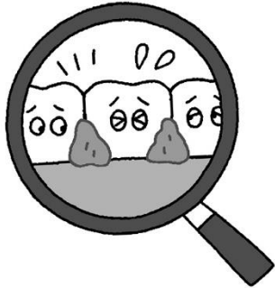
歯肉炎の原因は、歯と歯肉の境目にたまった歯垢