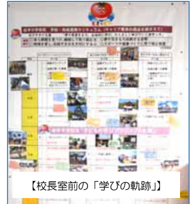
【校長室前の「学びの軌跡」】

中学生や高校生の時期は、新しい体験や多くの人との出会いで自分自身を変え(Change)、高める機会(Chance)が、多いものです。結果を恐れることなく、何事にも一歩を踏み出してみる気持ち(Challenge)をもってこれからの学校生活を送ってほしいと思っています。