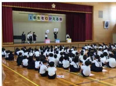
運営集会委員会からのクイズ

最後に1年生からのお礼の言葉。元気でかわいらしいあいさつに対して、会場は拍手でいっぱいになりました。とてもあたたかい雰囲気の集会になりました。