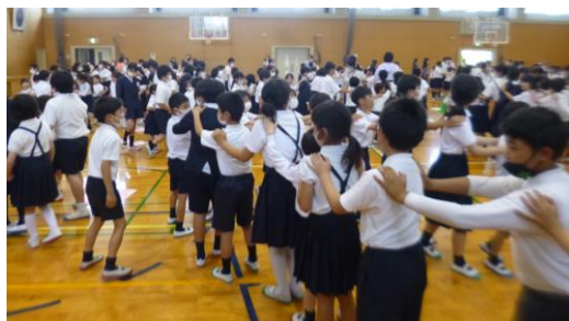
みんなでじゃんけん列車を楽しむ