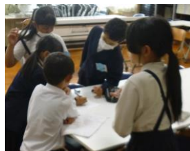
掃除の仕方を確認

川下小学校では、今年度も「だ・い・す・き掃除」を合い言葉に、「だまって」、「いっしょうけんめい」、「すみずみまで」、「きれいに」なるようにそれぞれの掃除場所で頑張ります。