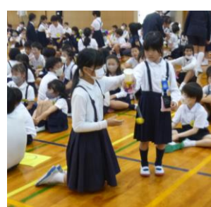
プレゼントはけん玉