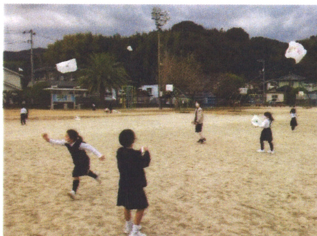
「たこ たこ 上がれ！」(1年生)