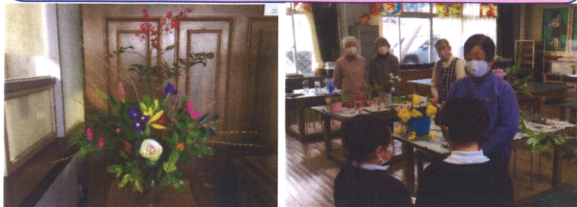
中央玄関のお花 6年生と2年生からお礼のお手紙