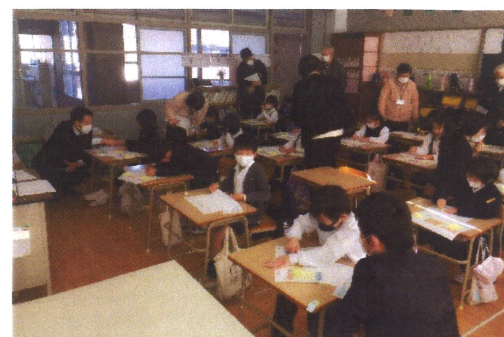
1年生プログラミング教育の授業：算数「もののいち」