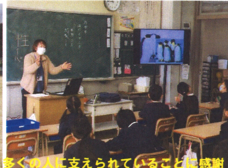
多くの人に支えられていることに感謝！