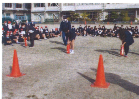
「火の用心！」火災避難訓練