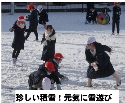
珍しい積雪！元気に雪遊び