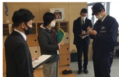
警察官へ状況を説明