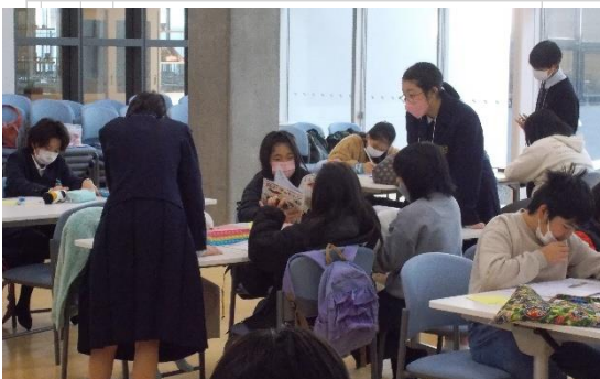
高校生から教えてもらいました

「放課後子どもプラン～地域の子どもたちに穏やかな居場所づくり事業」を、本校では「ひがしっ子ホームルーム」として、様々な企画を計画・運営していただいています。12/26・27には「宿題を早くすませよう」という企画を実施しました。市内の高校生ボランティア10名も参加して、本校児童と冬休みの課題に取り組みました。その後もペタンク大会への参加やAFPY体験など、ユニークな企画が続いています。