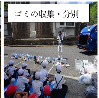
ゴミの収集・分別

1学期は、地域の先生20名近くにご来校いただきました。錦清流線、税金、錦帯橋、バリアフリー、白へび、ゴミ、短歌教室など、その道のプロに教わることで、学習を深めることができました。