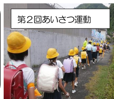
第2回あいさつ運動

先日ある地域の方から「うちの地区の子どもたちはよくあいさつしますよ」という声を聞き、嬉しくなりました。友達同士で、朝一番にあいさつを交わしている様子も、とても気持ちが良いものです。あいさつが習慣化して、進んでできる子もいますが、まだまだ意識していない子もいます。「あいさつは人と人をつなぐ魔法の道具」です。大人からもしっかり声をかけていきます。