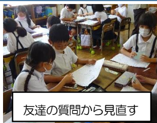
友達の質問から見直す

授業での対話 1年生から6年生まで、どの学年も対話をもとに、自分の考えを見直す活動を大切にしています。