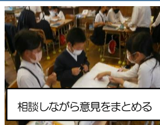
相談しながら意見をまとめる