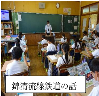
錦清流線鉄道の話