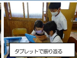
タブレットで振り返る