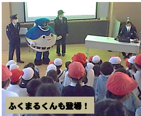
ふくまるくんも登場！