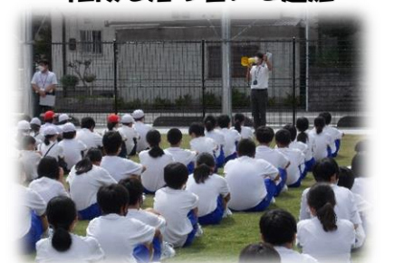
全児童生徒が芝グラウンドへ