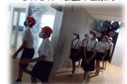
階段を落ち着いて避難