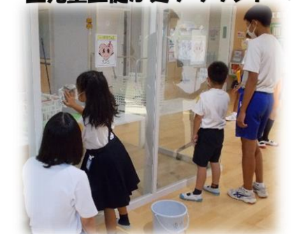
中学生が小学生に掃除の仕方を教えてくれています