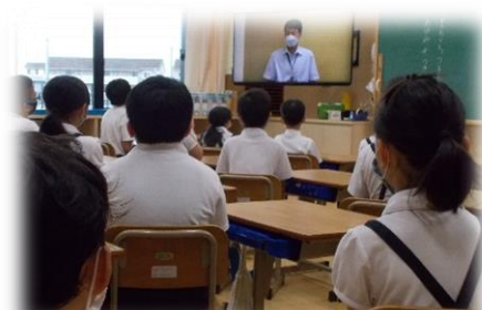
それぞれの教室で始業式