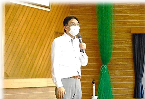
山口金融広報委員会アドバイザーから安全なSNSの使い方についてテキストをもとに講演をしていただきました。