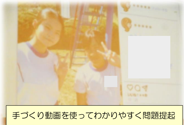
手づくり動画を使ってわかりやすく問題提起