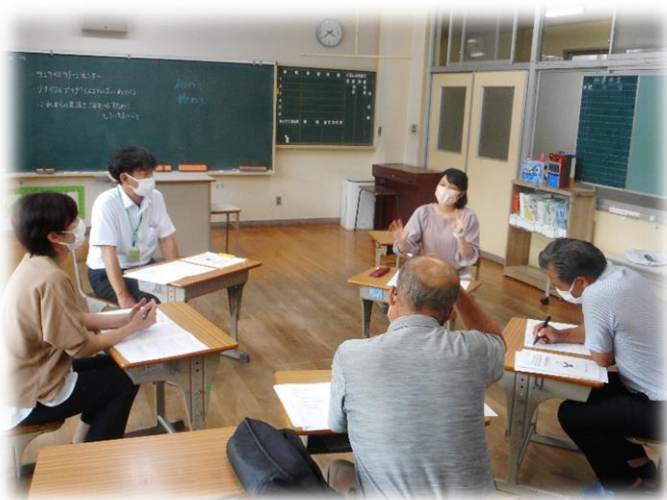
生活をつなぐ部会

協議会では、学力調査の結果や7月のアンケート結果から、本校をもっと良くするための貴重なご意見をいただきました。これまではコロナ禍でなかなか子どもたちの普段のようすを見ていただくことができませんでしたが、この日は子どもたちの元気な姿をみていただくことができました。今後も本校の課題解決にむけて、学校・地域・家庭が一丸となって美和東小の子どもたちのためにがんばります。