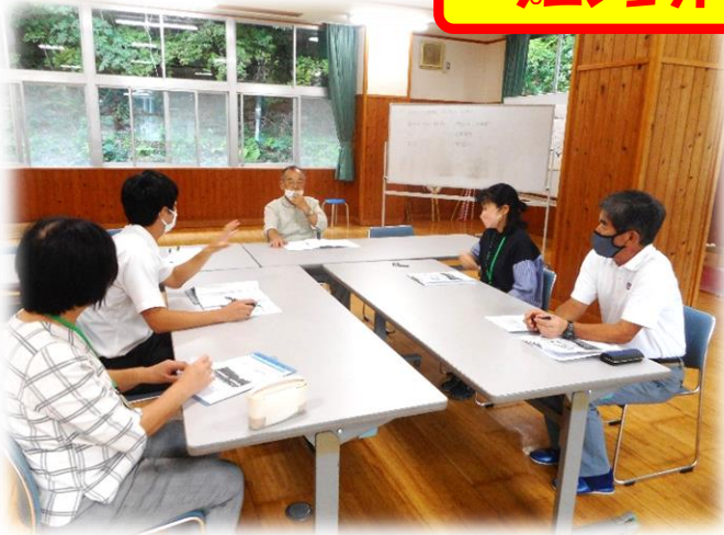
学びをつなぐ部会