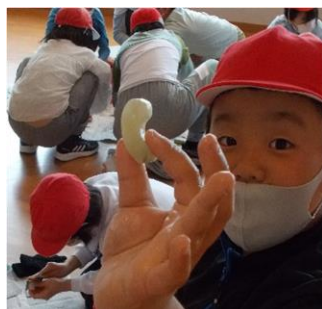
勾玉づくりに取り組みました