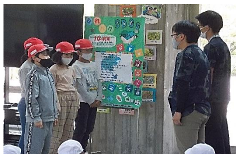
退所式でのお礼のことば