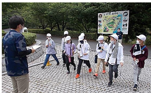
ウォークラリー、みんなそろってゴール